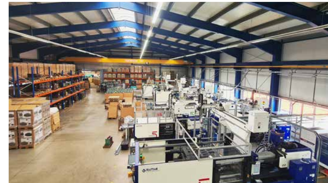
... nach der Neu-Investition in Kirchberg im Wald auch auf die Herstellung weiterer Spritzgussartikel und Kunststoffteile.

Um die bisherige Fertigung in Niederbayern langfristig zu sichern und zugleich effizienter zu werden, wurde am Produktionsstandort in Kirchberg im Wald konsequent investiert. So hat die GaB GmbH als Teil der Krinner-Gruppe ein klares Bekenntnis zum Standort abgegeben, indem sie den bislang gemieteten Gewerbebetrieb erworben und