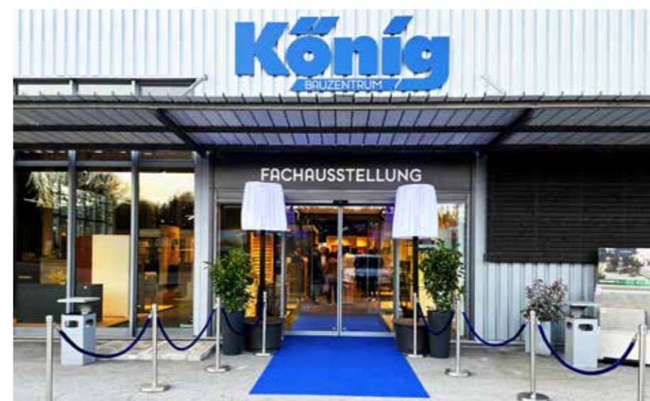
Das neue Bauzentrum ist jetzt Ansprechpartner für alle Bauphasen von Planung bis Innenausstattung.

monatlang auf die Eröffnung hingearbeitet“, so Killinger. Hinter der Neuausrichtung steht ein gemeinsamer Beschluss der beteiligten Gesellschafter aus den Unternehmensgruppen Zillinger und Schierer. Ziel ist es, Abläufe zu bündeln und das Angebot klarer auf die Bedürfnisse der Kunden auszurichten. Dazu gehört neben dem Sortiment auch die Beratung, die das Unternehmen als