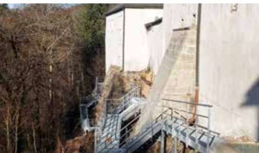
Die Konstruktion am steilen Abhang.