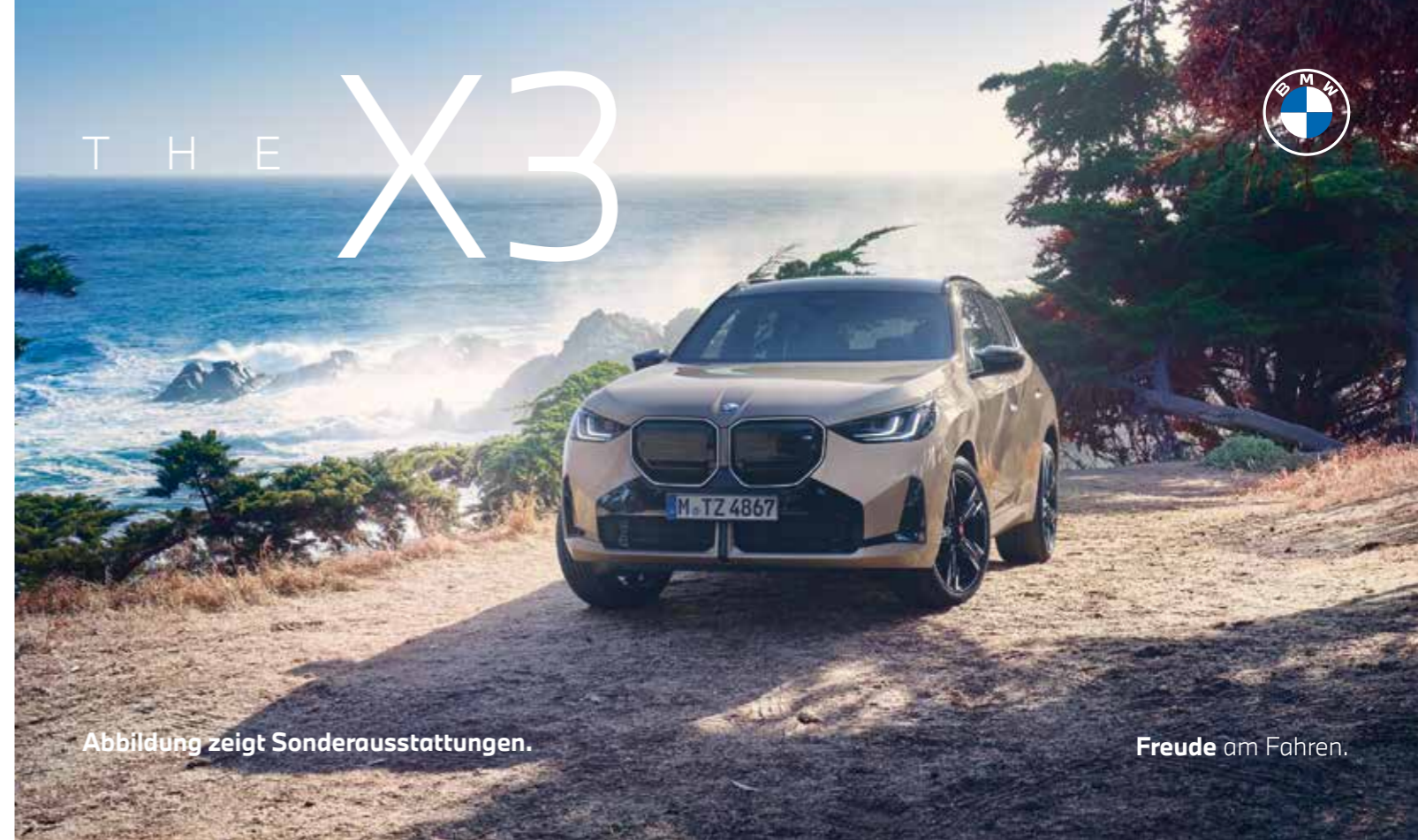
Abbildung zeigt Sonderausstattungen.