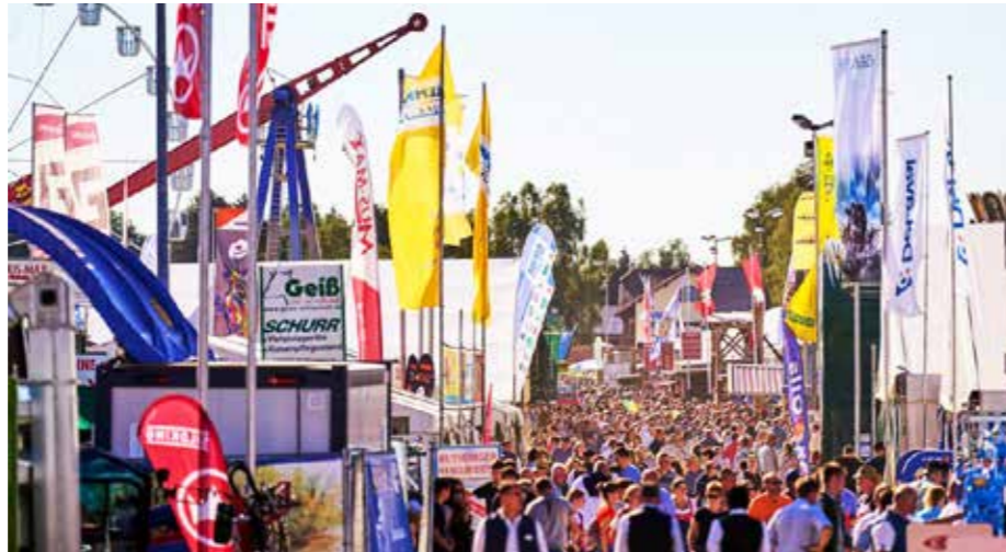
Karpfham ist Kult: Vom 27. August bis 1. September schwingt sich wieder alles zu einem der großen bayerischen Volksfeste und zur Rottalschau auf.

Die Rottalschau gilt als eine der bedeutendsten und größten Landwirtschaftsmessen Süddeutschlands. Jahr für Jahr kommen Besucher aus Deutschland und