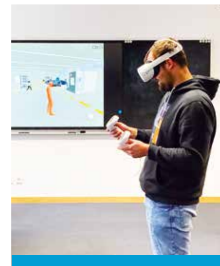
Auch das ist Lernen bei der IHK-Akademie: Weiterbildung per VR-Brille.