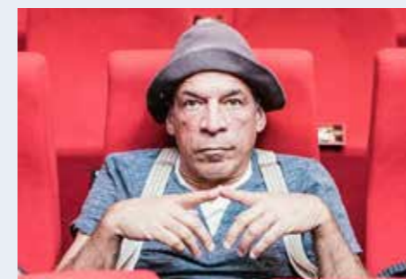
Peter Shub aus den USA: einer der berühmtesten Clowns der Welt mit Engagements von Roncalli New York bis Cirque du Soleil in Monte Carlo.

Seit inzwischen 20 Jahren hat sich das Festival zu einem festen Termin im bayerischen Herbst entwickelt. Traditionell am dritten Septemberwochenende – 2026 vom 18. bis 20. September – wird