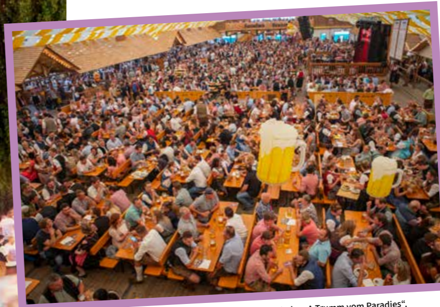
Von 7. bis 17. August 2026 ist Straubing wieder „A Trumm vom Paradies“.