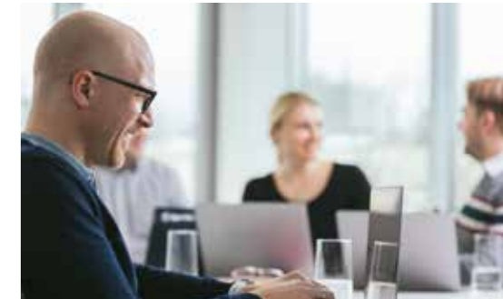
Interdisziplinäre international aufgestellte Teams bringen ihre Expertise für die Kunden der SPG ein.

administrative Prozesslösungen sowie IT-Service-Management. Neben dem Projektgeschäft investiert das Unternehmen auch in neue Geschäftsfelder, Kooperationen und Eigenentwicklungen.