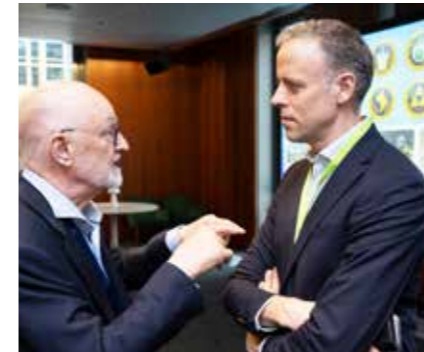
Der Staatssekretär im neu geschaffenen Bundesministerium für Digitales und Staatsmodernisierung, Markus Richter (rechts), brachte den Unternehmern aktuelle Punkte aus dem Digitalministerium näher.

Der diesjährige IHK-Tag in Berlin stand unter dem Leitmotiv: „Wie wird Wirtschaft(en) in Deutschland einfacher?“ Neben dem Bundeskanzler stellten sich weitere hochrangige Politiker der Diskussion. So betonte die Parlamentarische Staatssekretärin im Bundesministerium für Wirtschaft und Energie Gitta Connemann – sie ist auch Beauftragte der Bundesregierung für den Mittelstand – den hohen Stellenwert der kleinen und mittleren Un-