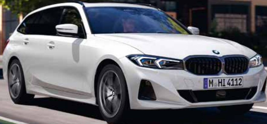
Abbildung zeigt Sonderausstattungen.